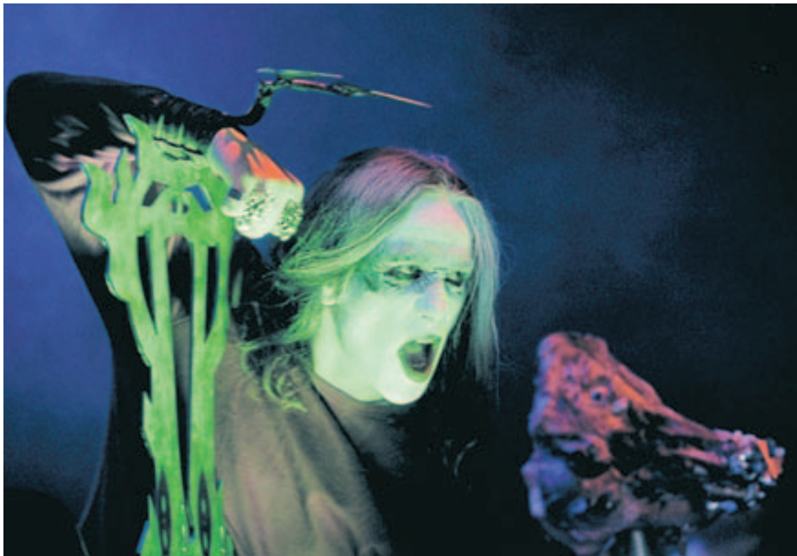
MYTOMSPUNNET BAND. Norska Mayhem är ett av de mest mytomspunna banden inom norsk black metal. Detta beror främst på att en del kyrkbränningar följt i bandets spår samt att bandet drabbats av både ett självmord och ett mord under årens lopp.

Andra band som var mycket viktiga i black metals barndom var svenska Bathory, danska Mercyful Fate, schweiziska Hellhammer – som senare bytte namn till Celtic Frost, norska Mayhem och brasilianska Sarcófago. Dessa band hade alla ungefär samma visuella framtoning och struktur på sin musik.